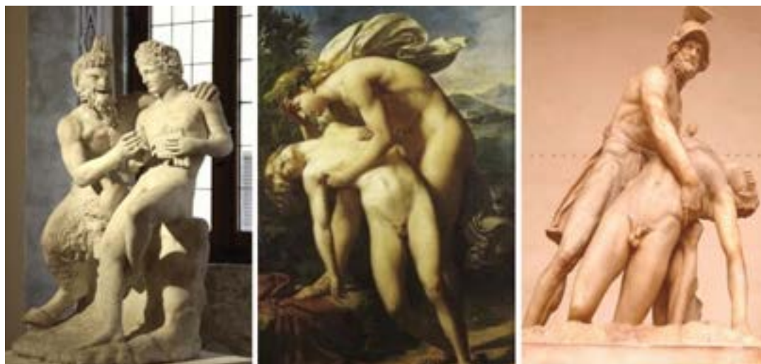
Dafnis e Pã, Ameinias e Narciso, Aquiles e Patroclo, como exemplo arquetípico de Magia Homossexual Anal.

Davi e Jonathan Buda e Ananda Marsias e Olimpo Hercules e Hílas Socrates e Alcibiades Damon e Pitias Hadrian e Antinous Aquiles e Patroclo Ameinias e Narciso Dafnis e Pã